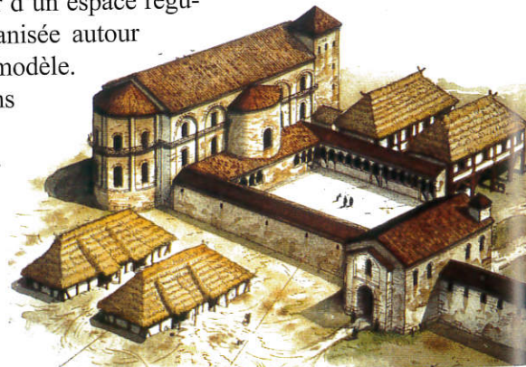
Fig. 3 : Palais de Charlemagne, à Aix-la-Chapelle, l'aula et la cour à portiques. Restitution.

Quel était l'usage de ces galeries à portique ? Peut-être une survivance de la tradition péripatéticienne des philosophes de